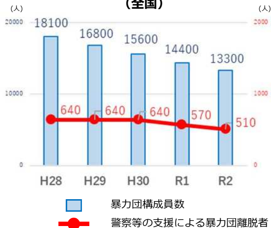
暴力団構成員数と暴力団離脱者数の推移 (全国)

愛知県では、県警や(公財)暴力追放愛知県民会議をはじめとする関係機関が 愛知県暴力団離脱者対策協議会 を設立し、企業の皆様と協力して、暴力団員の社会復帰対策を推進しています。