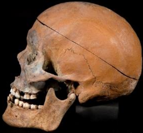
復顔像を制作した青谷弥生人の頭蓋骨（西暦2世紀）