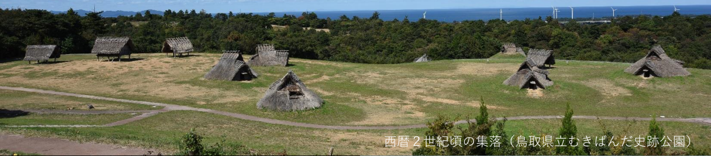
西暦2世紀頃の集落（鳥取県立むきばんだ史跡公園）