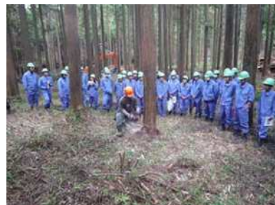
林業事業体の作業を見学する高校生

平成23年10月に全国森林組合連合会による「林業事業体の経営専門家派遣」により、森林組合が経営診断及び改善指導を受けられるよう指導・支援しました。