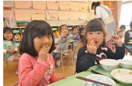
地元農産物を学校給食で利用

また、子供たちに地元農産物を知ってもらう取組を支援し、刈谷市及び西尾市の小学校では、「良いきゅうりの日(4月19日)」の給食の時間に、西三河冬春きゅうり部会の生産者がきゅうりの話をしました。