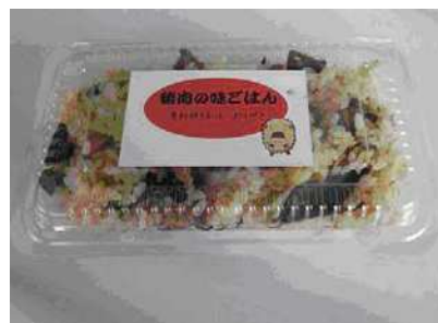
農業祭で試食販売した猪肉の味ごはん

岡崎市農業祭で加工品の試食会を行い、消費者の声を聞きました。また、あいちブランド創出委員会で、学識者を変え、獣肉活用の情報交換を行いました。