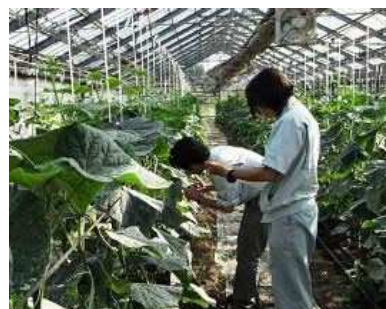
天敵農薬の導入調査