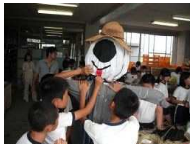
小学校における案山子作り

J A西三河が地域の農家の協力を得て、管内の小学校14校と連携して実施した農業体験学習に対して支援しました。