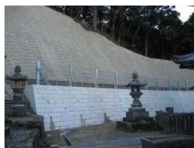
治山施設の整備状況

保安林の公益的機能の発揮のため、森林の適正な保育(本数調整伐)工事を66ha実施しました。