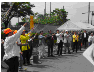
農地水活動組織 西端環境保全会 水と緑のウォーキング 知事出席 (水環境整備事業 中井筋地区)

干潟・藻場の保全活動の取組組織である「幡豆地区干潟・藻場を保全する会」が実施した干潟の底質改良のためトラクターによる耕うん、アマモ場を回復するための種子採取・選別・播種などの保全活動を指導・支援しました。