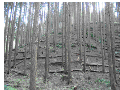
間伐整備した森林

平成23年5月から森林所有者や市町等に対して、造林事業及びあいち森と緑づくり事業による間伐に関する各種事業の説明会を開催するとともに、地域の森林・林業関連行事においても普及PRを行い、事業周知を図りました。