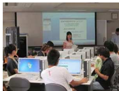
若い女性農業者と青年農業者へのパソコン研修