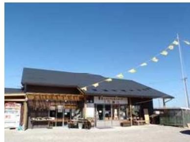
新たな産直施設「太陽の味」

岡崎市の「じさんじよの会」及び「鳥川ホテル保存会」の2団体が実施した地域住民活動を支援し、中山間地域の活性化を図りました。