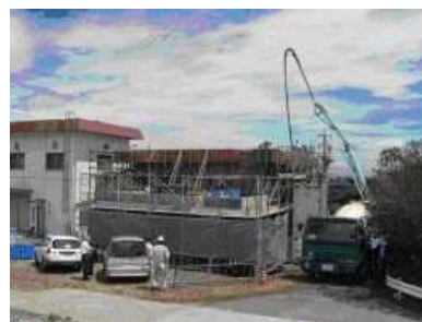
たん水防除事業一色西部地区 (排水機場整備)

緊急海岸整備事業により碧南地区・吉田地区・西尾地区の海岸樋門や堤防の整備を実施しました。