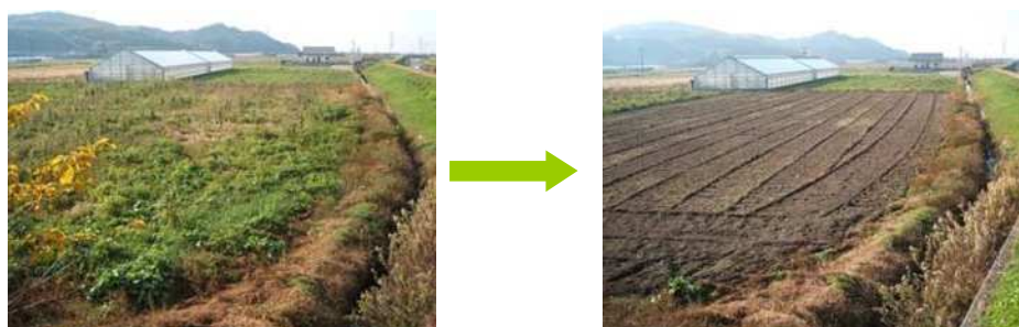
耕作放棄地の再生（左：再生前、右：再生後）