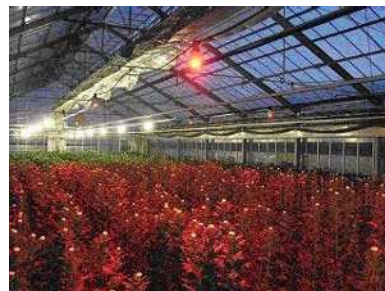
電球型蛍光灯を利用した キク栽培（西尾市）

鉢花生産者の研究組織で、重油削減に向けた研究会を開催しました。個別指導で施設の環境調査を実施し、重油使用量削減とヒートポンプ導入に向け啓発しました。