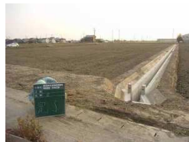
住環境整備事業深池地区 （ほ場整備）

畑地帯総合整備事業により伏見屋地区では用水路整備、住環境整備事業により深池地区ではほ場整備、排水対策特別事業により深池地区では排水路、排水機場の整備を実施しました。