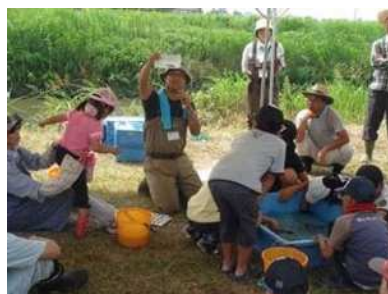
田んぼの生き物調査