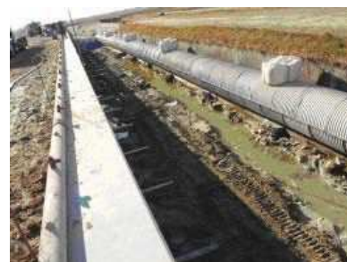
かんがい排水事業中井筋地区 （排水路整備）

かんがい排水事業により中井筋地区では排水路・村高地区では用水路、特定農業用管水路等特別対策事業により金山地区では用水路、土地改良総合整備事業により富好地区では用水路、水質保全対策事業により吉田1期地区では排水路、農業水利施設整備事業により吉良地区では揚水機場の整備を実施しました。