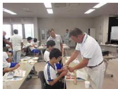
少年水産教室でのロープ実習

漁業地域の中学生を対象に開催された少年水産教室（平成23年8月2日）の参加者募集と教室運営に積極的に協力しました。