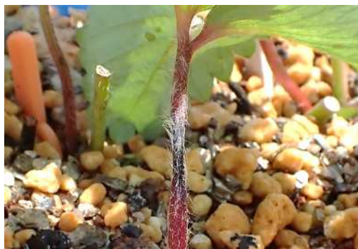
図2 葉柄の黒色病斑