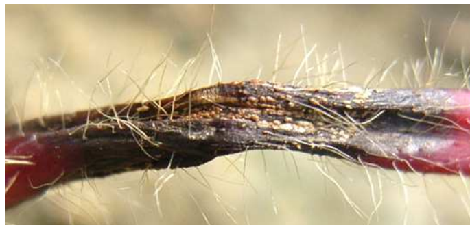
図3 病斑上にできた鮭肉色の分生子層