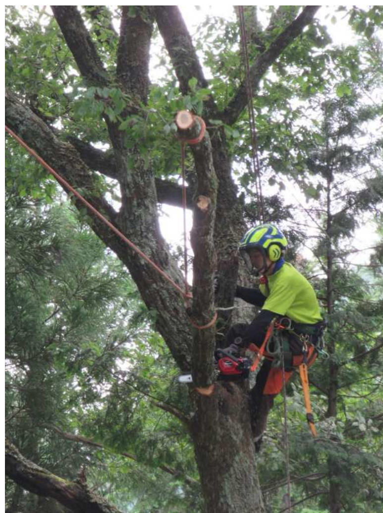
高所特殊作業による枝落とし