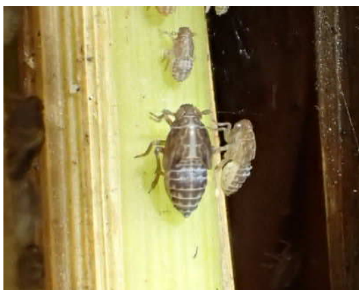
図2 トビイロウンカの幼虫