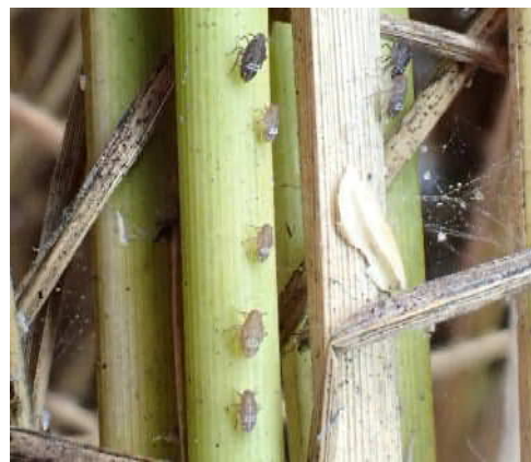
図3 株元に群生するトビイロウンカの幼虫