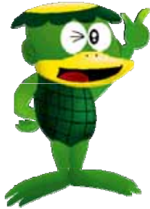
愛知県企業庁のマスコット キャラクター「カッパくん」

平成25年5月20日（月） 愛知県企業庁水道部 水道事業課浄水・水質グループ 担当 鈴木・服部 内線5642・5643 (ダイヤル) 052-954-6683