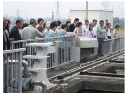
（浄水場見学の様子）