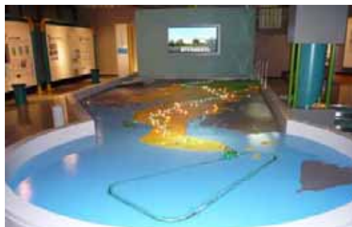
( 「水の生活館」展示の様子 )

水の生活館は、常設の県営水道及び県営工業用水道の資料館です。①愛知用水が通水する以前の、水に苦勞した当時の生活用具や農業用具の展示、②水の不思議な力や働きについて体感して、水に関する知識をクイズ形式で学ぶ展示などをご覧ください。