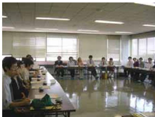
( 地域住民との水道懇談会 )