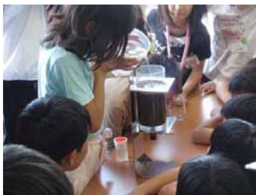
( 出張講座の様子(浄水実験) )

今年度は、平成24年6月20日(木)の津島市立蛭間小学校を始めとして、年間20校程度で出張講座を実施する予定です。