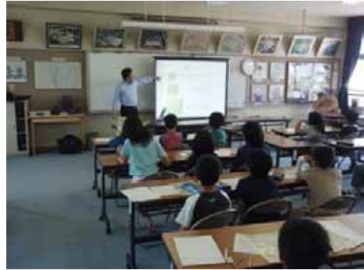
( 出張講座の様子 (スライド説明) )