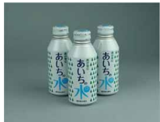
（ボトルウォーター「あいちの水」）