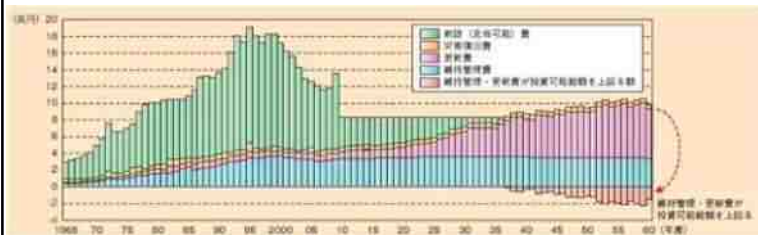
国土交通省「国土交通白書2009年版」より