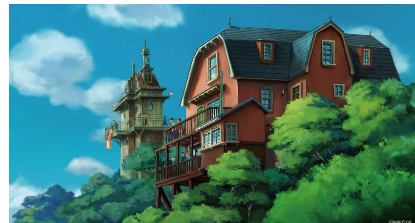
[ 地球屋 ]