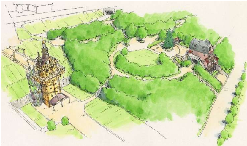
[ 鳥瞰図 ]