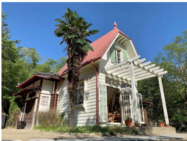
[ サツキとメイの家 ]

映画『となりのトトロ』の「サツキとメイの家」を中心とした昭和の田園景観をイメージしています。