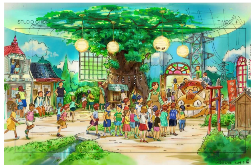
[ ネコバスルーム ]