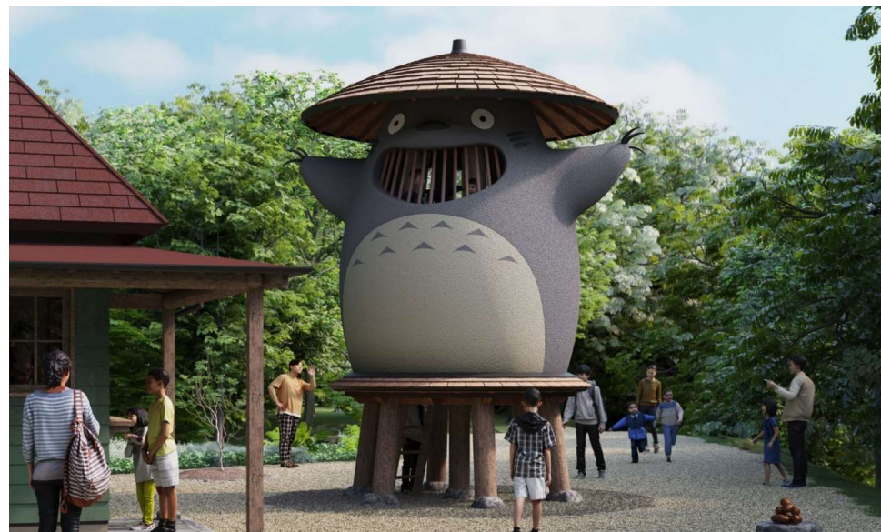
[ どんどこ堂 ]