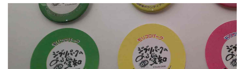
ワークショップにおいてロゴマーク入りの缶バッジを作成