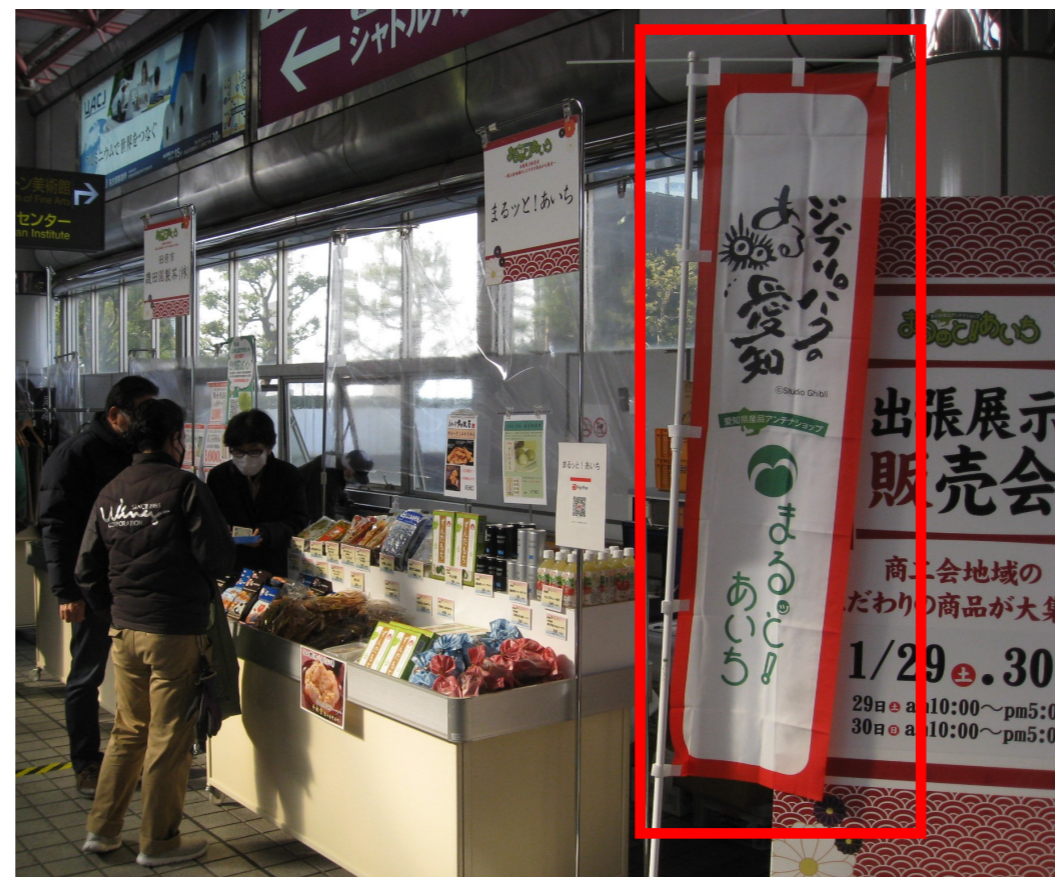
県産品を扱うPRイベントにおいてロゴマークを利用したのぼりを設置