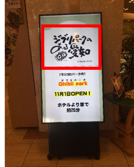
宿泊施設のデジタルサイネージにロゴマークを投影