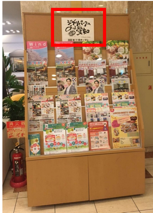
観光案内や地元広報誌等を配架するパンフレットラックにロゴマークの看板を設置