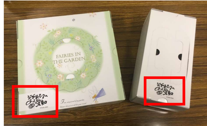
商品の購入後に使用する包装用の箱※1にロゴマークのシールを貼付け ※1ロゴマークを商品そのものに利用するなど、特定の商品の促進販売につながるような利用はできません（本県及びジブリパークのPRに特に効果がある場合を除く。）