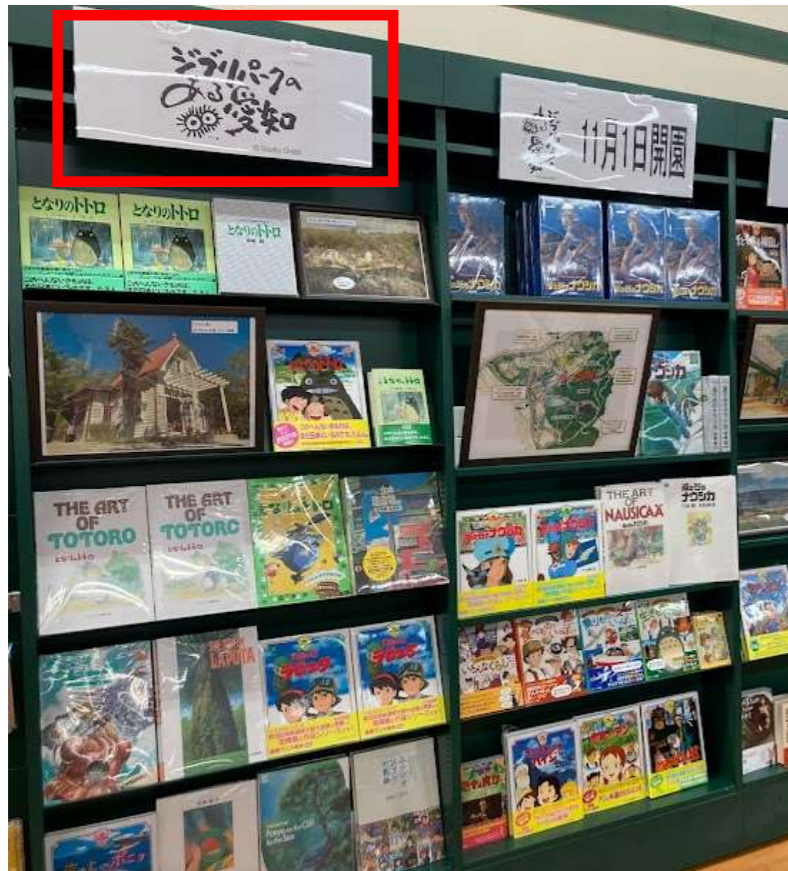
書店のジブリコーナーにロゴマークのパネルを設置