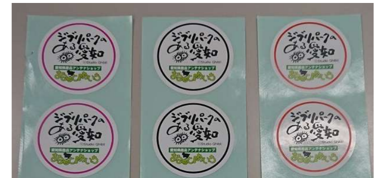
県産品を扱うPRイベントにおいてロゴマークを利用したシールを全商品※2に貼付け ※2特定の商品だけにシールを貼ることは、特定の商品の販売促進につながるためできません。