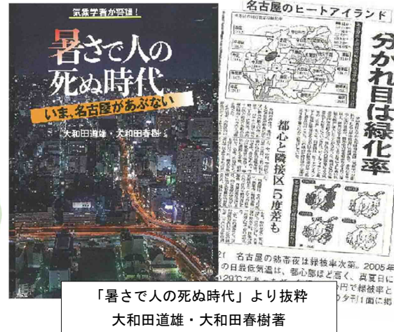
「暑さで人の死ぬ時代」より抜粋 大和田道雄・大和田春樹著

手間はかかるけど、 多くの人に役割があり、 自然と寄り添う地に足のついた暮らしを、 ジブリパークをきっかけにみんなで考える (カーボンニュートラル、グリーンコミュニティ)