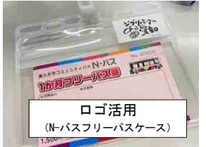
ロゴ活用 (N-バスフリーパスケース)