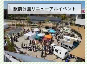
駅前公園リニューアルイベント