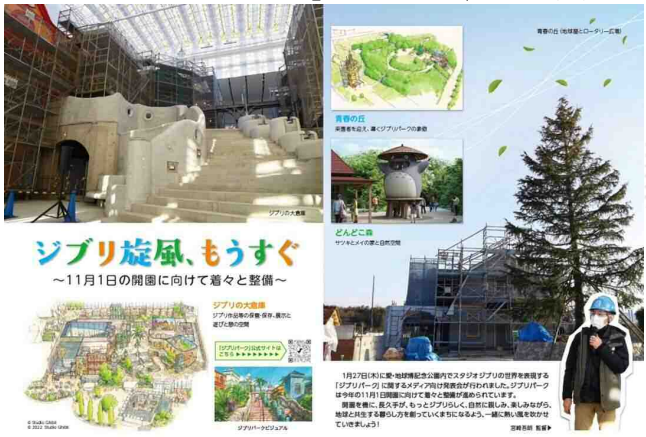
広報ながくて3月号記事