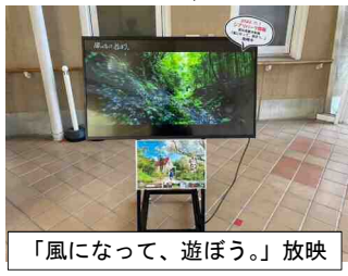
「風になって、遊ぼう。」放映