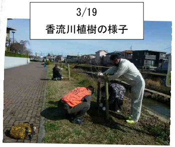
3/19 香流川植樹の様子