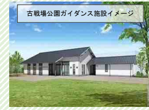
古戦場公園ガイダンス施設イメージ