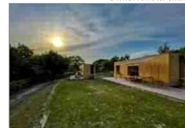
パークフィールドスノーピーク豊田鞍ヶ池「住箱」

民間活力を活用し、日本有数のアウトドアメーカー「スノーピーク」が手がけるキャンプフィールドやレストラン、カフェ「スターバックス」等を整備