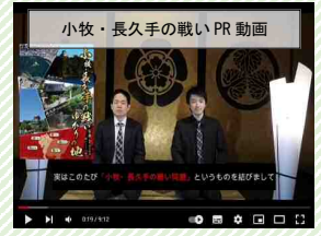
小牧・長久手の戦いPR動画