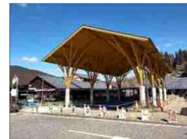
道の駅「どんぐりの里いなぶ」大屋根広場

豊田市唯一の道の駅として、売場の改修や大屋根広場を整備し、リニューアルイベントを実施することで、山村地域を中心とした豊田市の魅力を発信