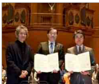
名古屋フィルハーモニー管弦楽団との協定締結(H30.2)