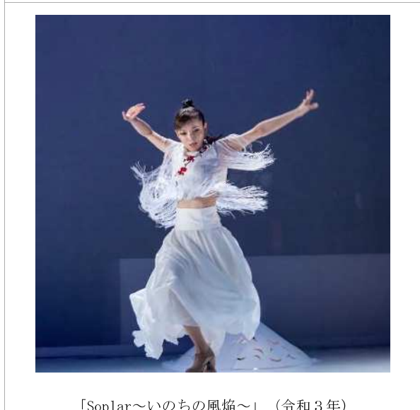
「Soplar～いのちの風焔～」（令和3年）