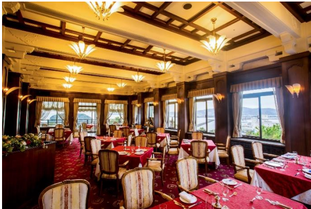
本館 メインダイニングルーム