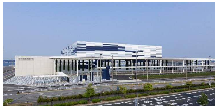
Aichi Sky Expo

愛知県は、製造業を中心とした世界有数の産業集積があり、国際空港や高規格道路網など充実した交通インフラを有しています。Aichi Sky Expo(愛知県国際展示場)は、こうした愛知県の特性を活かし、展示会等を通じた多様な交流の促進等による新産業の創出や既存産業の強化などを図っています。また、国内外からの集客による産業首都愛知の新たな交流・イノベーション拠点の創造に寄与していきます。