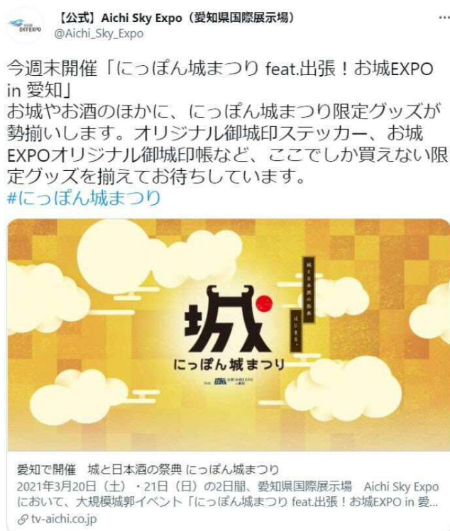
公式 SNS スクリーンショット

前年に引き続き Aichi Sky Expo ホームページ、また公式 SNS アカウントを通じて最新のイベント情報や見どころ、催事の様子等を来場者促進につながるよう積極的な発信を行いました。また、初の自主開催イベント「JAPAN×FRANCE LIFESTYLE EXPO 2021- HYBRID EDITION-」(2021年4月)の出展ブースの紹介等、フランスと日本のライフスタイル関連企業のビジネスマッチングが可能となるよう、プレスリリースを8件発信しました。