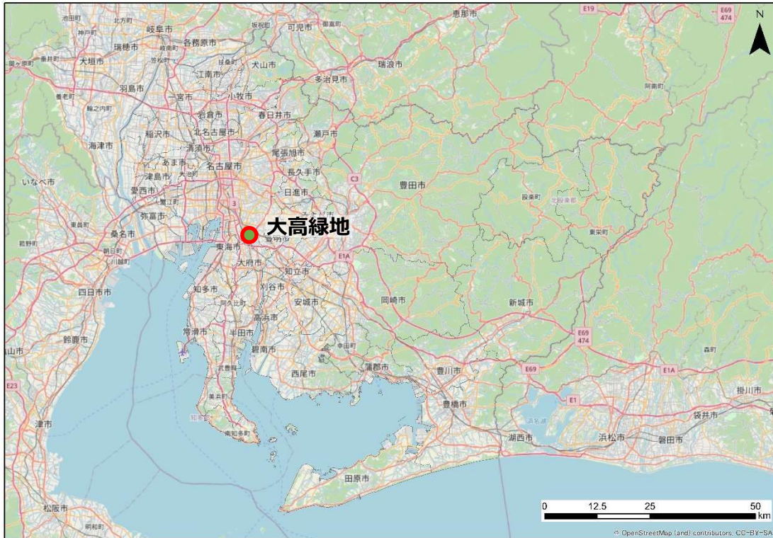
図 1 大高緑地の位置図

大高緑地プール跡地の位置図、平面図、施設概要は以下のとおりです。なお、大高緑地の概要は別紙1「6公園の概要」、大高緑地及び大高緑地プール跡地の写真は別紙2「6公園の写真」を参照してください。