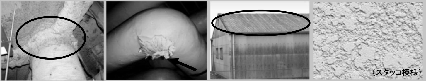
吹付け石綿(レベル1)