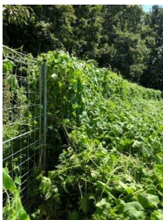
つる草が絡んだ柵 (放置すると風で倒伏することもある)

整備直後でも柵に不具合が生じることがあるので、 点検は避けられません 。柵沿いに歩いて点検することで野生獣の痕跡等も観察でき、集落環境点検としても有意義です。設置ルート ※ の状況にもよりますが、 春から夏にかけては1～2か月に1回程度、秋から冬は3～4か月に1回程度点検するよう働きかけましょう 。さらに、台風や大雨の直後は臨時点検が必要です。