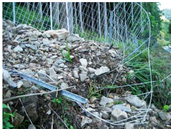
土砂崩れによる損壊 (放置するとイノシシやシカの出入口になる)