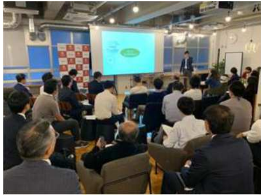
2019年度 バッチ Batch01 ネットワーキング プログラム（事前説明会）の様子 （2019年11月25日）