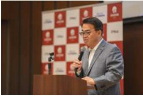
2019年度 バッチ Batch01 ネットワーキング プログラム（事前説明会）の様子 （2019年7月5日）