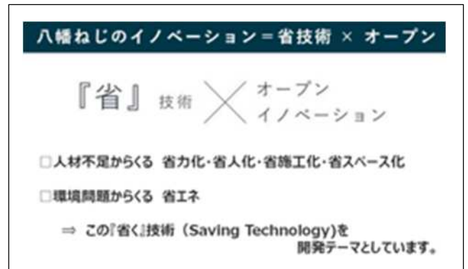
2020年度 バッチ Batch02 ネットワーキング プログラム（事前説明会）の事例紹介 （2020年12月25日）