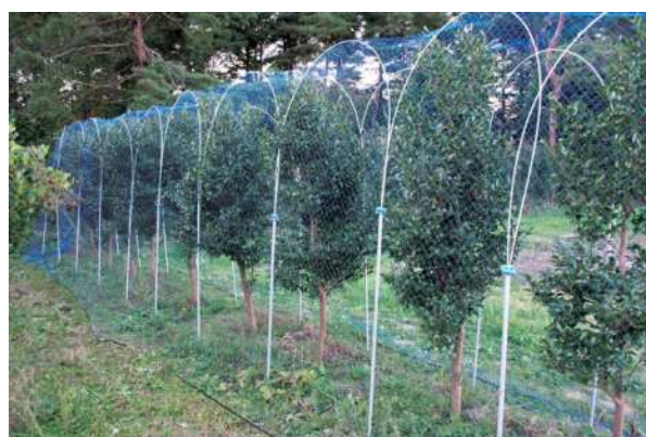
果樹園に「らくらく設置3.5」を設置した様子