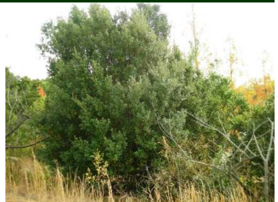
ほ場周辺の常緑の樹木が隠れ家