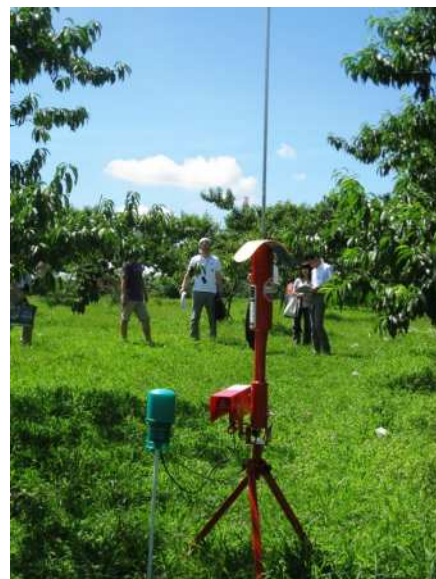
バードパンチャーなどの脅しグッズは時期限定で、違和感を与え続ける