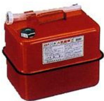
ガソリンの貯蔵に適した容器の例 (金属製容器であることが必要)