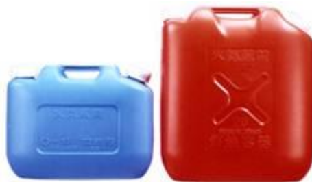
ガソリンの貯蔵に適さない容器の例 (樹脂製容器は火災危険性が高い)