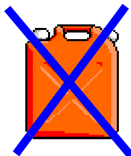
灯油用のポリタンク