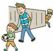
子どもの安全確保活動