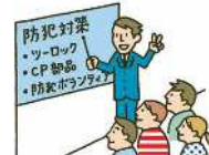
防犯教室・講習会活動