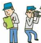
危険箇所点検活動