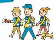
防犯パトロール活動