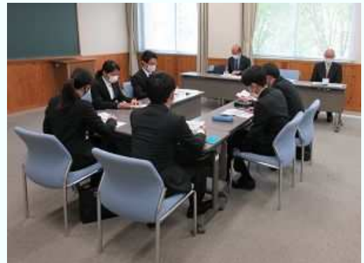
緊張の中、ディスカッションする学生

当日は2班に分かれ、①「理想の上司像」、②「社会人に必要な力」をそれぞれテーマにして演習しました。終了後、参加した学生からは、「緊張した」、「社会進行が難しかった」等の感想が聞かれ、ナビゲーターからは「多数決で議論を進めるのはダメ」、「4大生もいるが物怖じせずに」等のアドバイスがありました。（頑張れ農大生！）