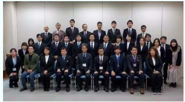
受講生と関係職員