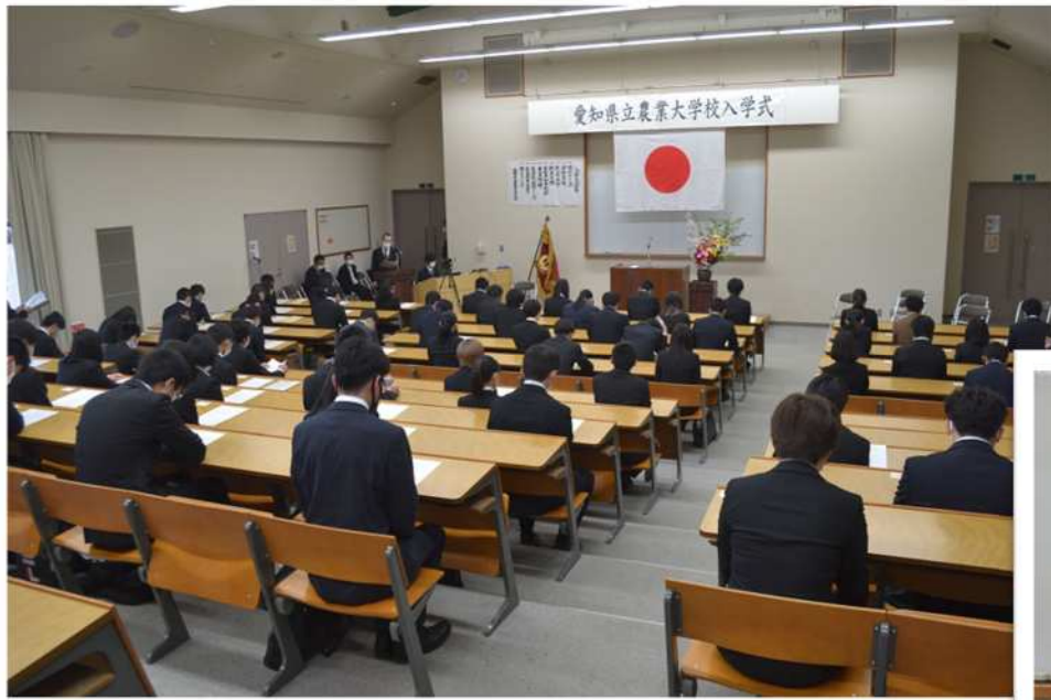
十分に席をあけて行われた入学式