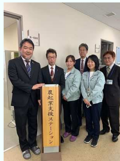
校長と農起業支援ステーションの関係職員

相談の結果、具体的に就農地や栽培品目が決定した後は、就農希望地を管轄する農起業支援センター（農業改良普及課）と連携して、農地の確保をはじめ、研修先農家の紹介、経営管理手法の習得、販路の確保等、就農実現に向けた具体的な支援を行う予定です。