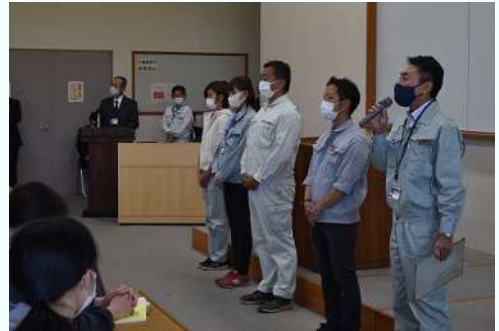
式の後、各科職員の紹介がありました

堤校長から「1年生は何を学び、何をしたいのか具体的な目標を持つことの大切さ、2年生は、農業界の即戦力となるために修得した知識とスキルに自信と誇りをもって臨んでもらいたい」と挨拶がありました。新入生にとって、待ちに待った農大でのキャンパスライフがスタートしました。この中から、愛知の農業を担うリーダーが大勢出てくることを期待しています。