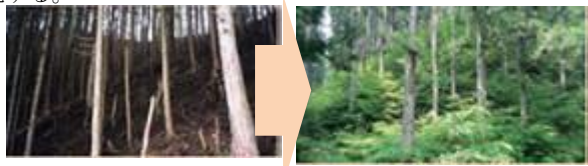
手入れ不足の森林