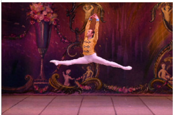
「くるみ割り人形」スペシャル全幕（令和2年）