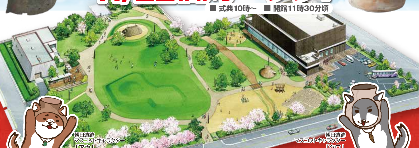
朝日遺跡 マスコットキャラクター 「アカ」