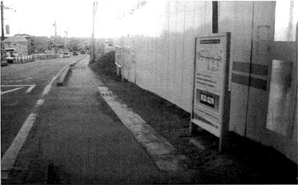
参考 PR看板設置例 (主) 名古屋岡崎線 道路改良工事