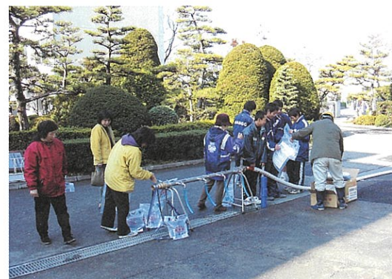
地震防災訓練の状況

県営水道はみなさんの生活や産業活動のライフラインとして重要な役割を果たしています。