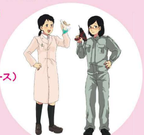
生活コースの新設により女子も学びやすい学習環境に!