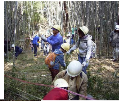
親山里山教室 の開催 （日進市）