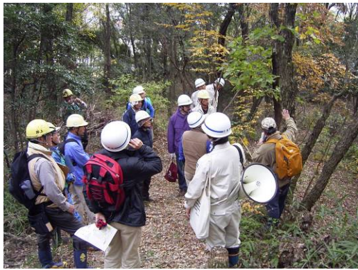
里山保全実践講座の開催（日進市）