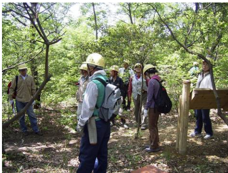
森づくり体験会の開催（日進市）