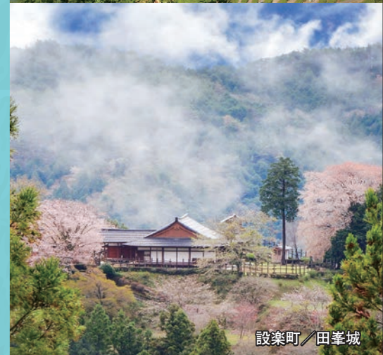
設楽町 / 田峯城