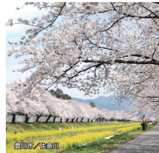
豊川市 / 佐奈川

※本誌掲載情報は令和2年3月現在のものです。ダイヤ改正により時刻に変更が生じる場合がありますので、お出かけの際は詳細をご確認ください。