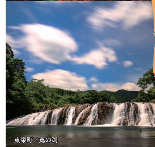
東栄町 / 鳶の淵