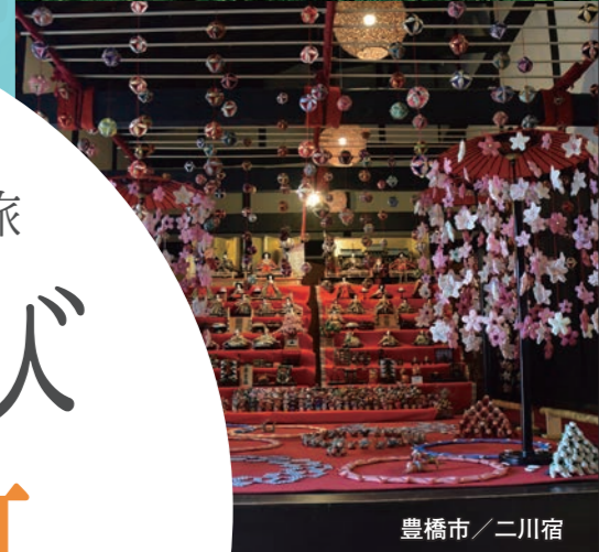
豊橋市 / 二川宿