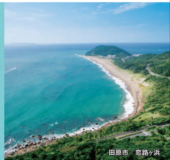
田原市 / 恋路ヶ浜