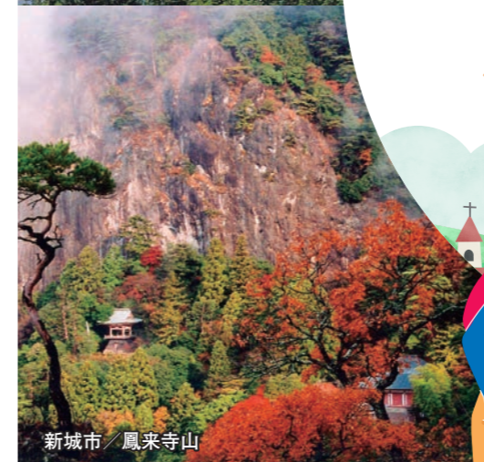
新城市 / 鳳来寺山