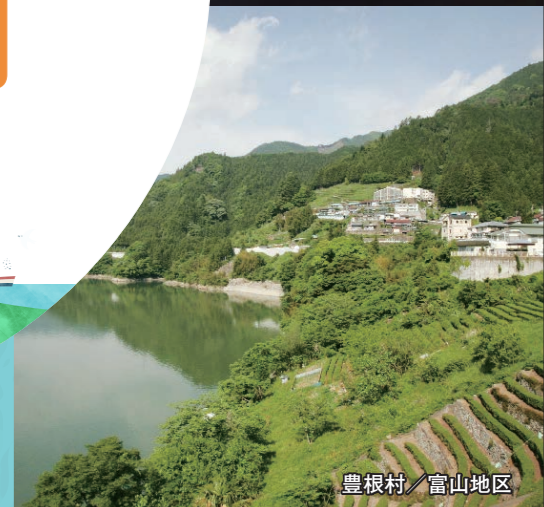
豊根村 / 富山地区