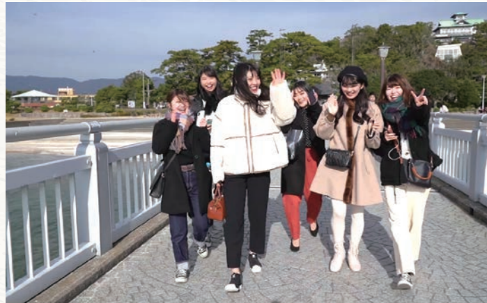
取材協力 梶山女子学園大学 現代マネジメント学部 水野英雄ゼミの皆様