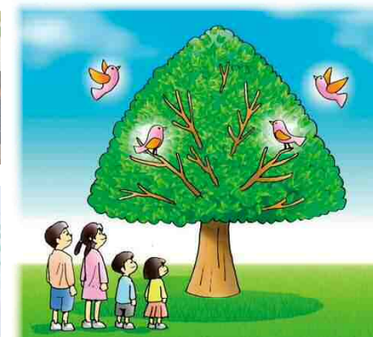
言の葉の大樹（イメージ）