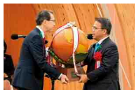
リレーセレモニー