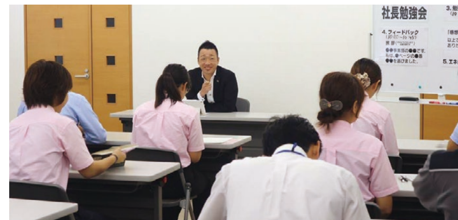
皆さんの真剣な姿勢が印象的な社長勉強会の様子。