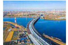
幹線道路ネットワークの整備 （名古屋環状2号線、名古屋西～飛鳥） （名古屋市、飛鳥村）