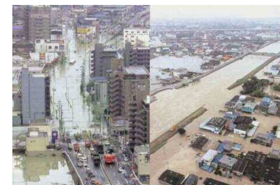
2000年9月の東海豪雨による被災状況