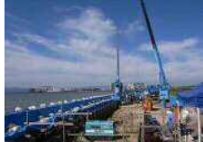
豊橋杉山海岸（豊橋市）