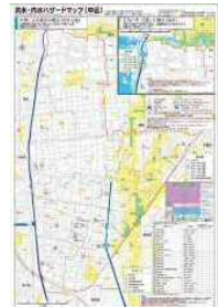
洪水・内水ハザードマップ （名古屋市中区、2019年8月時点）