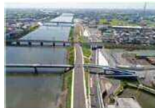
緊急輸送道路の整備 （一般県道平和蟹江線（蟹江町）） （名古屋市、飛鳥村）