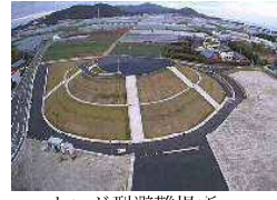
マウンド型避難場所 （田原市堀切地区「ほりきり広場」）