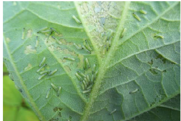
図3 ハスモンヨトウの幼虫