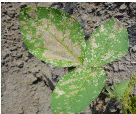
図2 ハスモンヨトウによるダイズの白変葉

ほ場での観察をしっかりと行い、白変葉（図2）および幼虫（図3）が見られたら、下表を参考に防除しましょう。