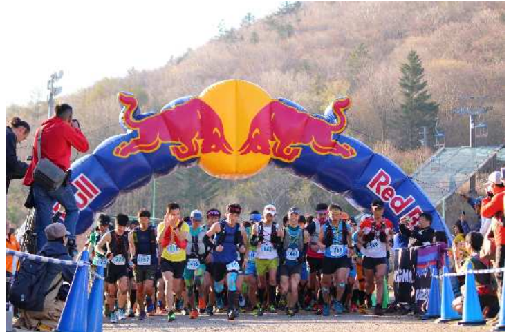
奥三河パワートレイル (平成 30 年 4 月 22 日)