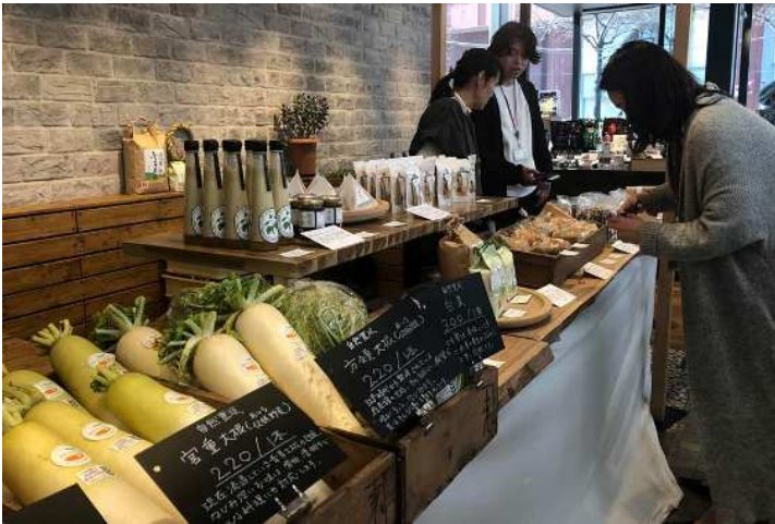
あいちの山里 Entre Store (平成 31 年 1 月 26 日～27 日)