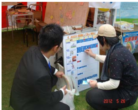
<アンケートボードに喫煙の有無により色分けしたシールを貼る>