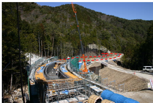
奥三河広域農道（橋梁工事の実施状況）