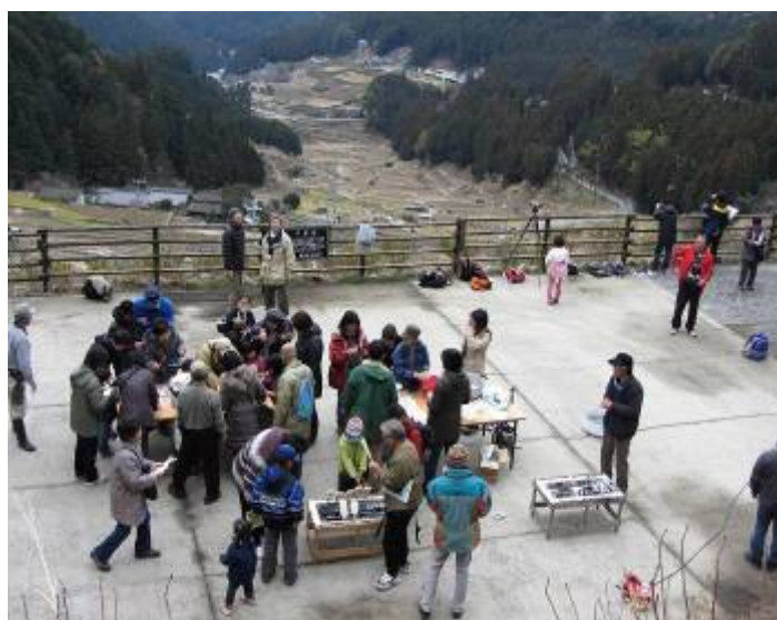
奥三河自然満喫ツアーでの 五平餅づくり体験の様子