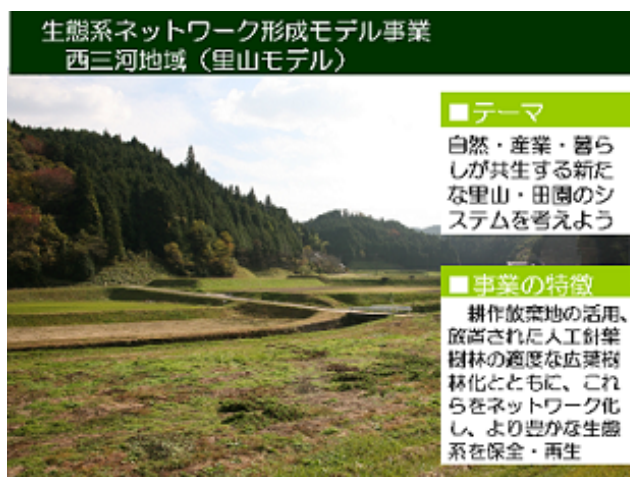
生態系ネットワーク形成モデル事業 西三河地域（里山モデル）