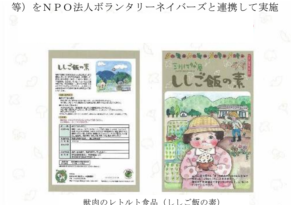
獣肉のレトルト食品（ししご飯の素）