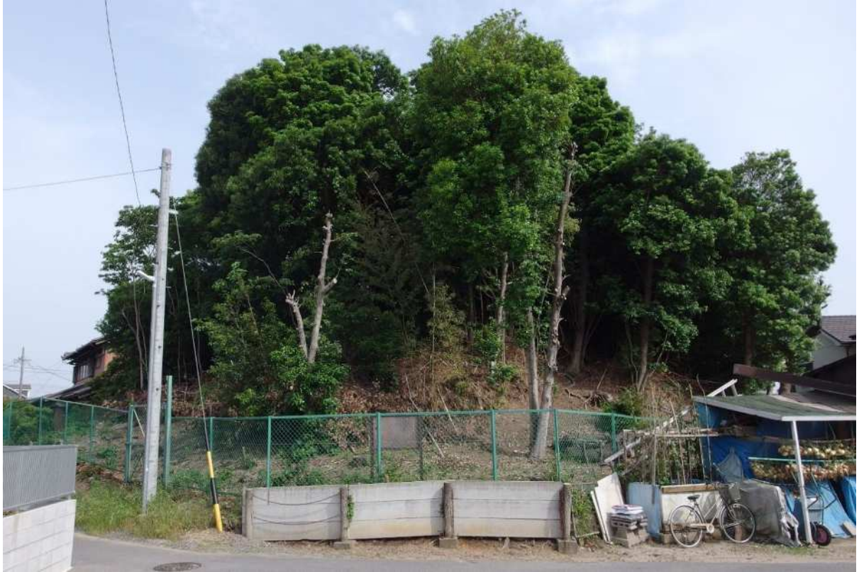
写真1 太夫塚古墳全景（北西から）