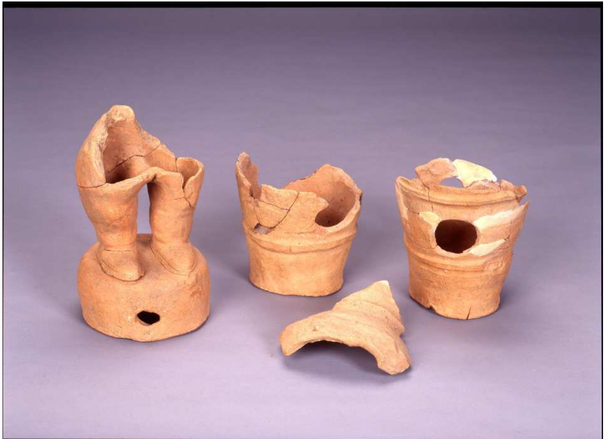
写真5 太夫塚古墳出土埴輪