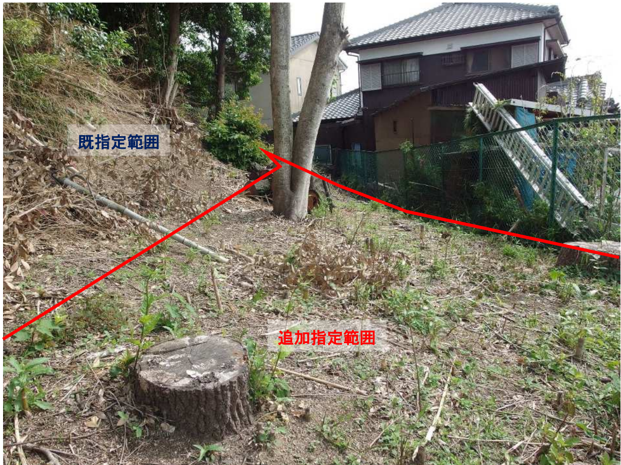
写真3 追加指定地（北から）