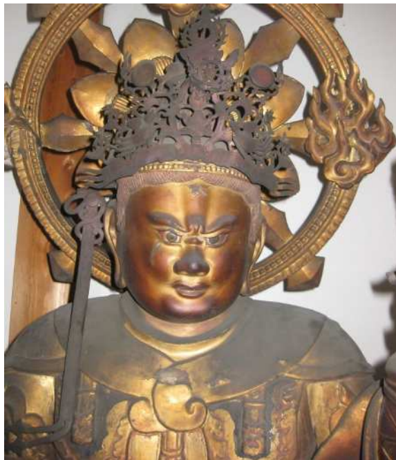
木造毘沙門天立像