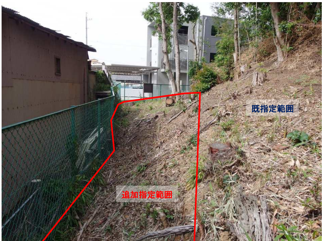
写真4 追加指定地（南から）