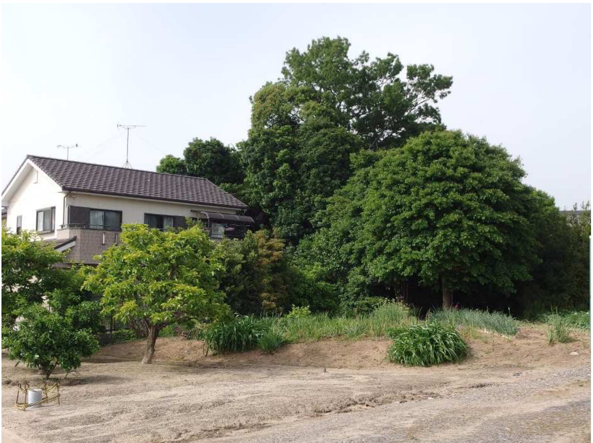
写真2 太夫塚古墳全景（南から）