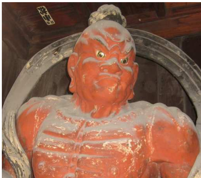
木造金剛力士立像(吽形像)