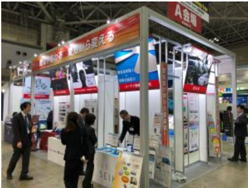
写真は昨年度同事業（AUTOMOTIVE WORLD 2018）の様子