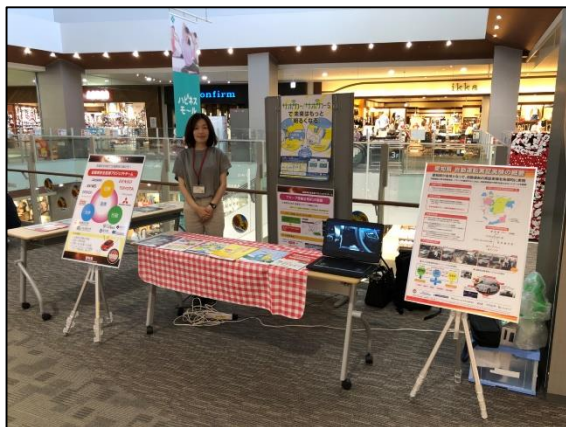
イオンモール名古屋茶屋