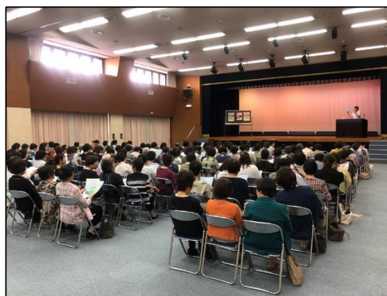
緑信用農業協同組合本店