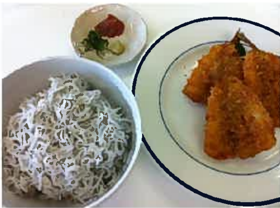
！キスのフライとお茶漬けにもできるシラス丼