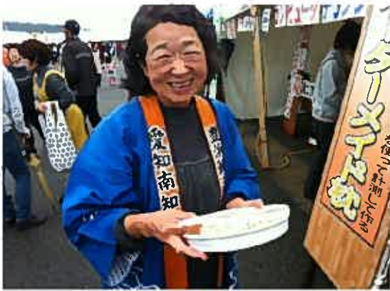
ハマクニさんのおせんべい☆