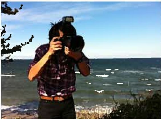
ハイジのブランコで撮影☆