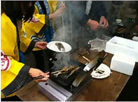
！漁協さんではお魚を焼いていました。