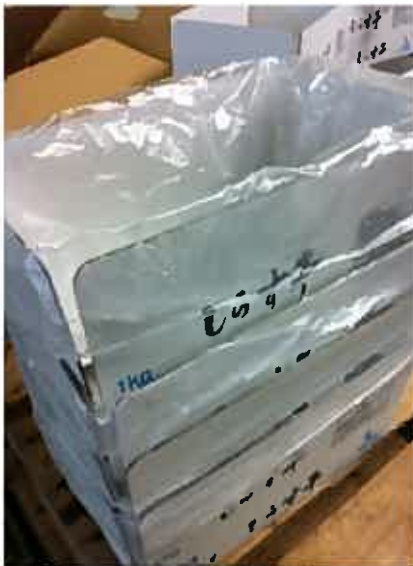
わたしがお手伝いしたのは「シラスの箱作り」☆