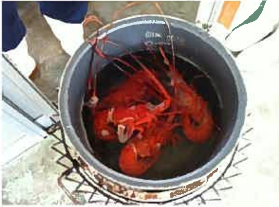
おいしそうな伊勢海老を茹でてくれました☆