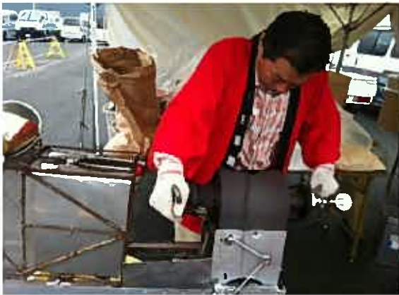
！ホン菓子作り実演