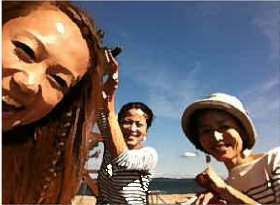
3人一緒に楽しく取材☆