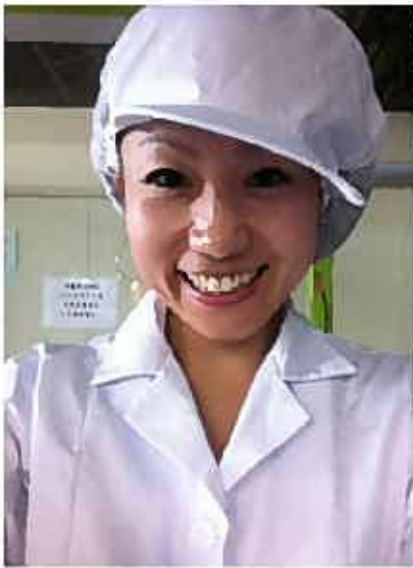
コスプレ気分でちょっと楽しい(笑)