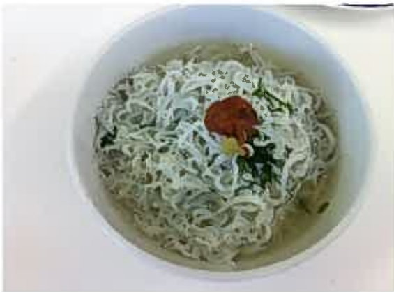
！シラス丼をお茶漬けで食べたら