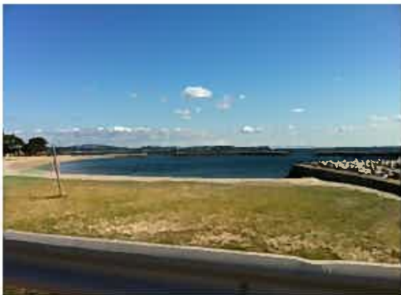
久々のいい天気でウキウキでした★