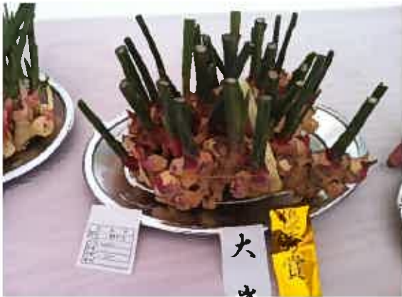
！品評会のコーナーもありました！