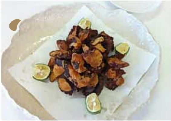
！あっさりしたタコ唐☆