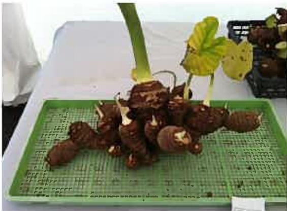
！さといもも、こう見るとひとつの芸術作品！