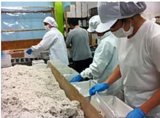
↑こんな感じで箱詰めしてます。