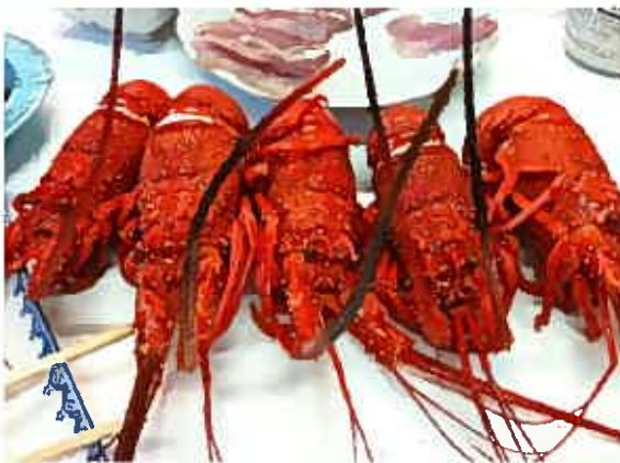
こうやって並ぶとなんかかわいい伊勢海老♡

そして、日間賀島にはシラスの加工場が4つあるらしいのですが、伊勢海老を食べていたら、「大弘丸」の親方のご兄弟が経営する「大弘丸水産」の方に、 “今シラスの加工してるから写真撮りにおいで〜” と言われ行ってみたら、 お手伝いする事になりました。