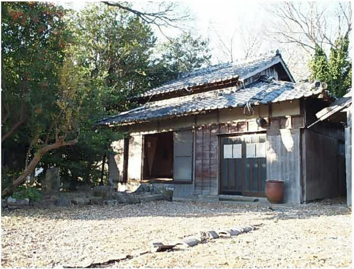
展示場所の空き家です。