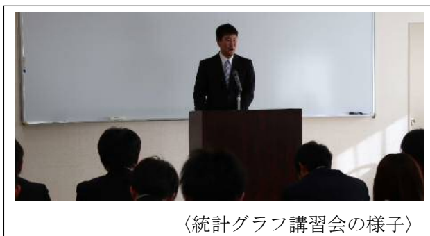
〈統計グラフ講習会の様子〉

岡崎市現職研修委員会算数・数学部会では、 統計教育の一環として、毎年算数・数学科主任 者会の折に、統計グラフ指導者講習会を実施し ている。全国・愛知県統計グラフコンクールで 実績のある教師を講師とし、統計グラフ作成の 指導ポイントを講習している。これまでの全 国・愛知県統計グラフコンクールでの入賞実 績を生かし、岡崎市全体の取り組みとして統計 グラフ作成を積極的に行っている。