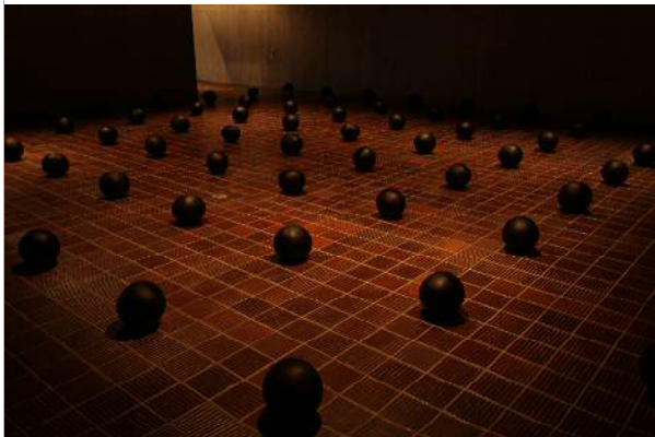
愛知県立芸術大学退任記念展