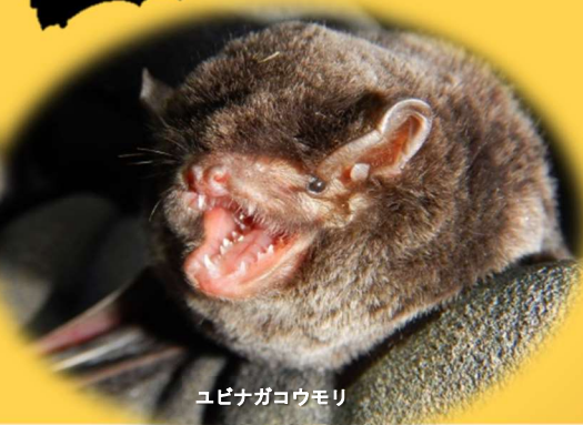
ユビナガコウモリ

よく知らないがゆえ、ひとくりに「コウモリ」とまとめて片付けられてしまっていますが、哺乳類の中では種の数がネズミ類に次いで多く、哺乳類の種の約4分の1を占めています。 実は愛知県にも色々なコウモリ類が住んでいます。 コウモリはどのような所に住み、どんな暮らしをしている生物なのか？ 夜行性のコウモリをどのような方法で調査・観察しているのか？など あまり知られていないコウモリの世界の話とともに海上の森で始まった「あいちコウモリ調査隊」の活動状況なども合わせて話題提供していただきます。