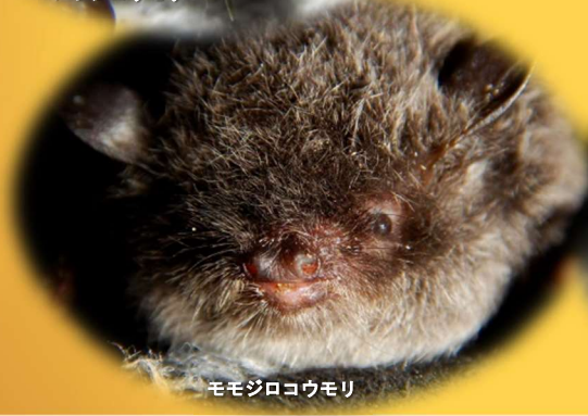
モモジロコウモリ