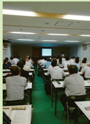
昨年の様子(講演会)

ハンセン病人権マンガ「麦ばあの島」の著作を通じて感じたこと、ハンセン病への取材を通じて感じたこと、愛知県出身で療養所に入所されている方から、伝えたいことをお話していただきます。