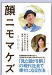
『顔二モマケズ』 水野 敬也 著 文響社