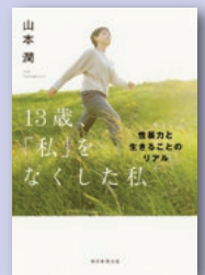
『13歳、私をなくした私 性暴力と生きることのリアル』 山本 潤 著 朝日新聞出版