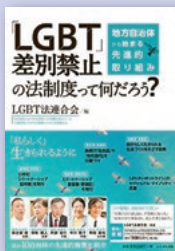
『「LGBT」差別禁止の 法制度って何だろう?』 LGBT法連合会 著 かもがわ出版