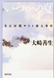
『いつかの夏』 名古屋園サイト殺人事件 大崎 善生 著 角川書店