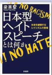
『日本型ヘイト スピーチとは何か』 梁 英聖 著 影書房