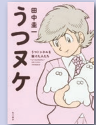
『うつヌケ』 田中 圭一 著 KADOKAWA