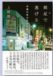
『裸足で逃げる』 上間 陽子 著 太田出版