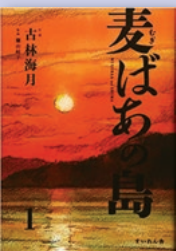
『麦ばあの島』 古林 海月 著 すいれん舎