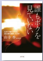
『誰もボクを見ていない』 山寺 香 著 ポプラ社