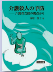
『介護殺人の予防～ 介護者支援の視点から』 湯浅悦子 著 フレス出版