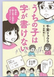
『うちの子は字が 書けない』 千葉 リョウコ 著 ポプラ社