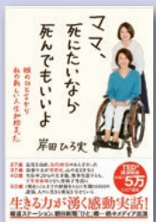
『ママ、死にたいなら 死んでもいいよ』 岸田 ひろ実 著 致知出版社