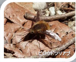
ピロウトツリアブ