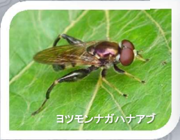
ヨツモンナガハナアブ