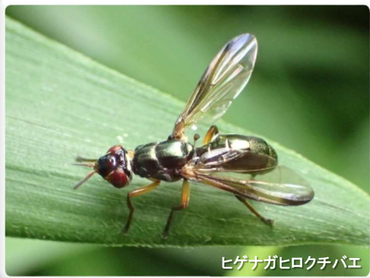
ヒゲナガヒロクチバエ

もしかしたら「イヤないきもの」の代表格かもしれないハエたち。「見たくない!」、「近寄るな!」と嫌われても、彼らは1年中、皆さんの目につくところ、つかないところで生活しています。このハエは何という名前?そして、このハエたちは普段どんな生活をしているのか?今回は、私が2016年3月から毎月1回、海上の森に通って出会ったハエたちを中心に、一般にはあまり知られていない彼らのことを紹介していきたいと思います。