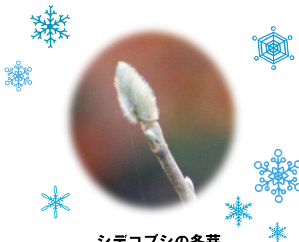
シデコブシの冬芽