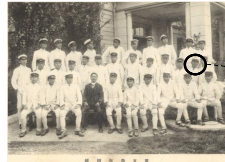
五年丙組集合写真