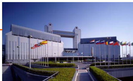
名古屋国際会議場 (会場予定地)

※この他に、岡山市では各種ステークホルダー（国連機関、研究者、学校関係者、民間企業、NPOなど）の会合が開催されます。